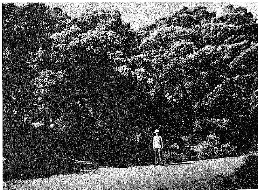
Photo 3. - Chêne vert ( Quercus ilex ssp. rotundifolia ) vers 1 200 m, au Turbon, Aragon.

Le rôle du Chêne pubescent, en moyenne montagne de ce versant des Pyrénées, n'est pas à mettre en doute car on connaît des vallées (Capdella-Rio Flamisell par exemple) où les Conifères sont presque totalement absents de cet étage.